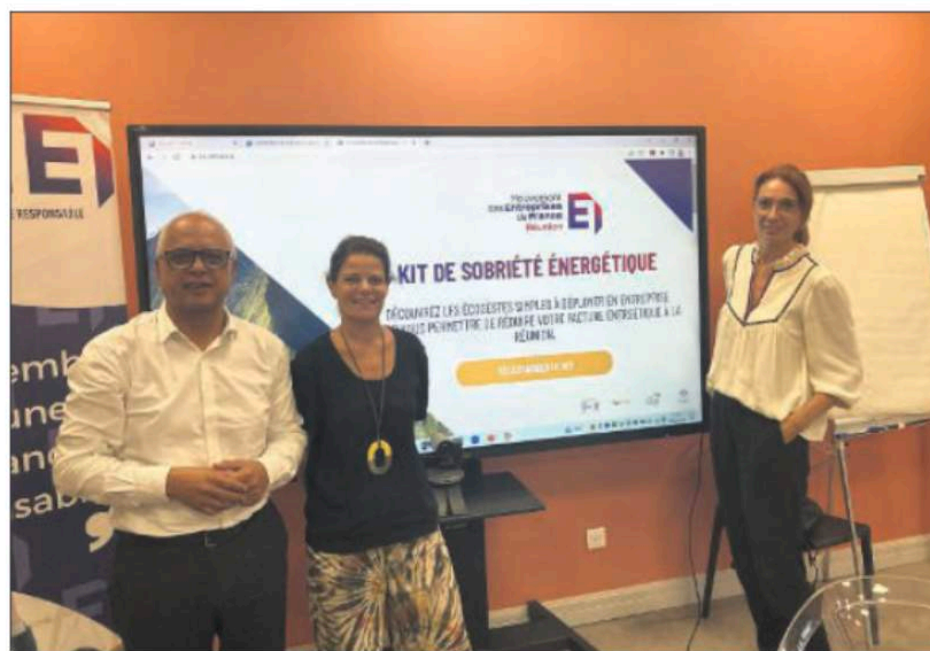
Le Medef Réunion et l'Ademe ont présenté hier un guide destiné aux entreprises.

Porté par Isodom, le programme Seize a pour objectif de sensibiliser les TPE-PME aux économies d'éner-